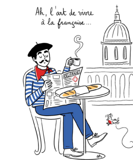
ILLUSTRATION Dessins personnalisés