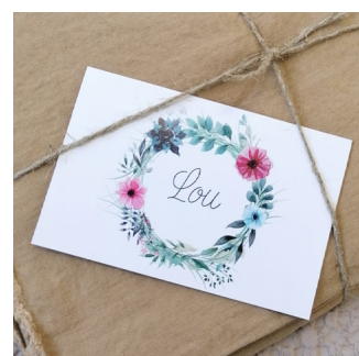
CONCEPT GRAPHIQUE Pour particuliers et pros !