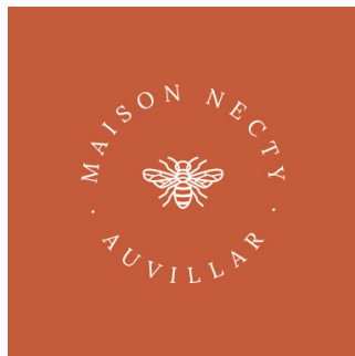
CONCEPT / BRANDING Logo & charte graphique

Intervenant sur vos supports prints et web, je vous initie à la prise en main du back-office de votre site internet. À l'issue de notre session, vous aurez tous les outils pour le faire vivre et l'alimenter en toute autonomie !