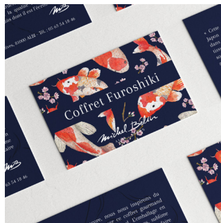
COMM. GRAPHIQUE Print (impression)