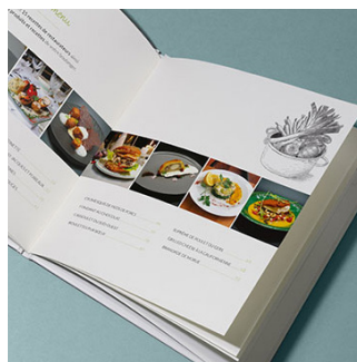
RÉDACTION Création de contenus