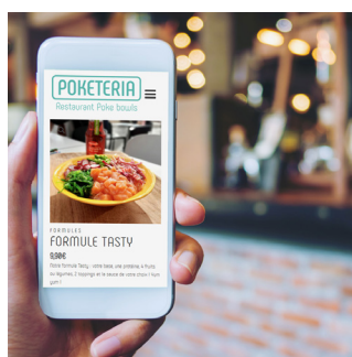
E-COMMERCE Vente en ligne, click & collect