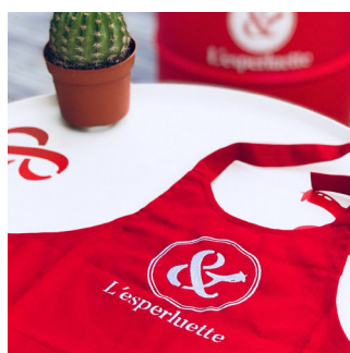
CRÉA GRAPHIQUE Print & web