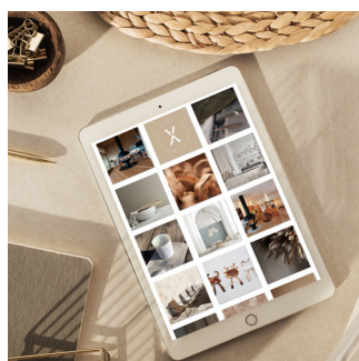
STRATÉGIE RÉSEAUX Réseaux sociaux optimisés