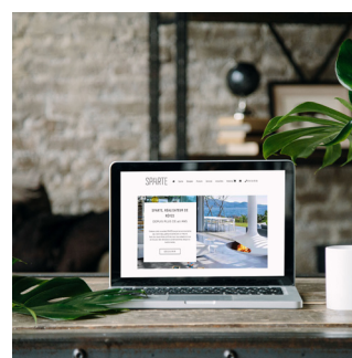
GESTION DE PROJETS Suivi et pilotage de projets