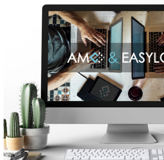
SEO (RÉF. GOOGLE) Référencement naturel