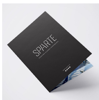
AUDIT COMM. / BESOINS Audit et préconisations