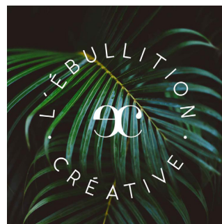
ACCOMPAGNEMENT NR Chef de projet labellisation