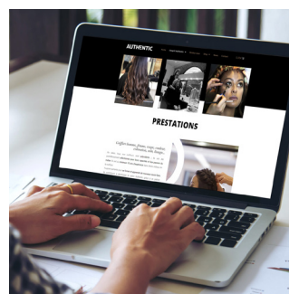
OPTIMISATION SEO Arborescence, textes